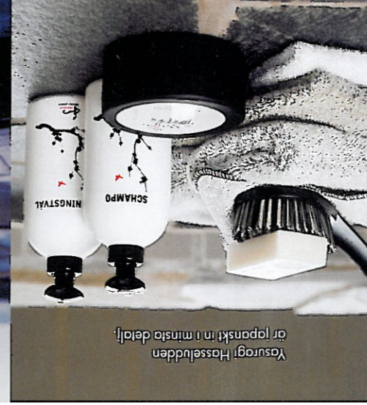
Yasuragi Hasseludden är japanskt in i minsta detalj.

Upplevelsen: Bara att resa hit till de värmländska skogarna och blicka ut över Fryken gör gott för själen. Selma Spa + stora styrka och framför allt – spavdelningen. Behandlingarna håller absolut toppklass. Köket är traditionellt träpall. Sedan väntar varma källor, simbassäng, viltstolar och frukttuffbord kvar vid sitt middagsbord med den under- Upplevelsen: Bara att resa hit till de värmländska skogarna och blicka ut över Fryken gör gott för själen. Selma Spa + stora styrka och framför allt – spavdelningen. Behandlingarna håller absolut toppklass. Köket är traditionellt träpall. Sedan väntar varma källor, simbassäng, viltstolar och frukttuffbord kvar vid sitt middagsbord med den under- Upplevelsen: Bara att resa hit till de värmländska skogarna och blicka ut över Fryken gör gott för själen. Selma Spa + stora styrka och framför allt – spavdelningen. Behandlingarna håller absolut toppklass. Köket är traditionellt träpall. Sedan väntar varma källor, simbassäng, viltstolar och frukttuffbord kvar vid sitt middagsbord med den under-