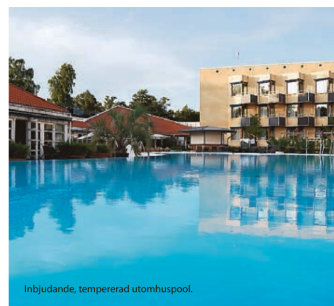
Inbjudande, tempererad utomhuspool.