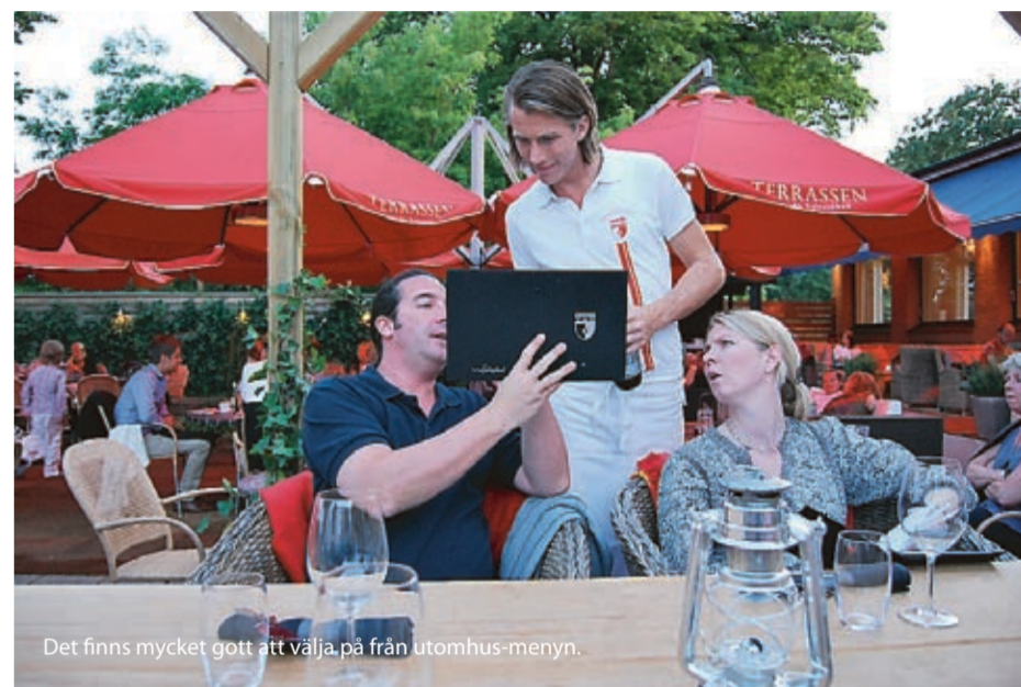
Det finns mycket gott att välja på från utomhus-meny.