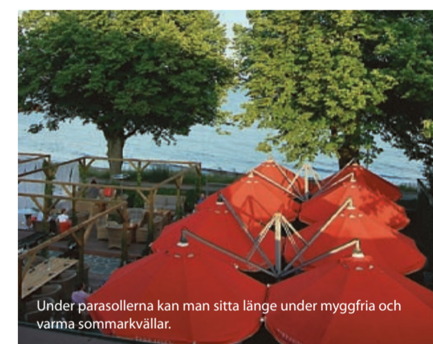
Under parasollerna kan man sitta länge under myggfria och varma sommarkvällar.