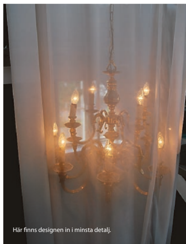
Här finns designen in i minsta detalj.